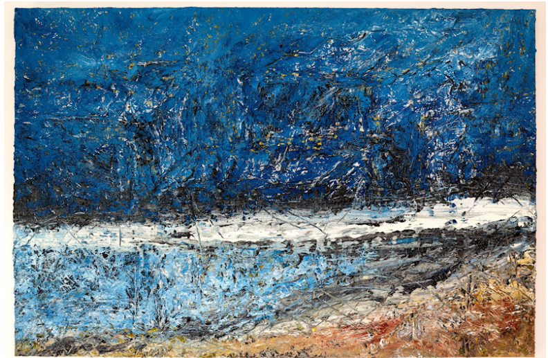
nuit blanche 08