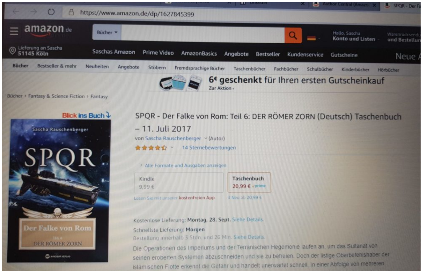
Abb.: WINDSOR-Treffer „SPQR – Der Falke von Rom – Teil 6“ bei amazon.de

Amazon ist besonders dreist, denn es verkauft von zwölf gelisteten Titeln des Autors sechs sogar ausschließlich als Plagiat. Trotz Hinweis 2018008 durch den Autor, dass der WINDSOR-Verlag nicht existiert. Und trotz zwischenzeitlicher Änderung auf BoD, was eine zweite Korrektur zu Gunsten des kriminellen Verlages dann offensichtlich macht. Und trotz dem Umstand, dass die zugehörigen ebooks ALLE auf BoD laufen.